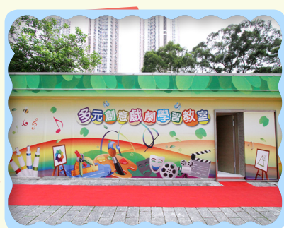
多元創意戲劇學習教室