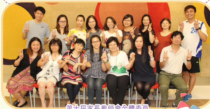
第十屆家長教師會全體委員

家教會積極為學生及家長舉辦多元化的活動，包括不同主題的家長工作坊及講座、興趣班及親子活動等；好讓家長充分掌握教導子女及親子溝通的技巧；家長亦樂於成為學校義工，經常參與及協助學校舉辦各類活動，彼此建立良好的夥伴關係，真正體驗家校合作的精神。