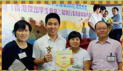
曾校長、老師及母親齊分享得獎的喜悅