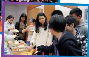
吃點小食，補充體力