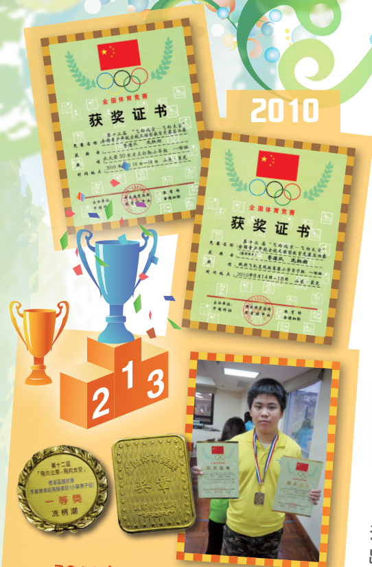
2010年在全國賽勇奪兩項一等獎