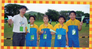
與老師及參加手擲紙飛機的隊友合照