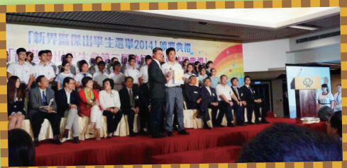
勇奪2014新界區傑出學生殊榮