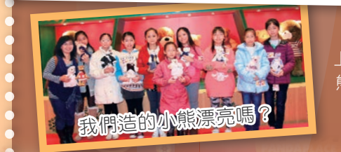
我們造的小熊漂亮嗎？