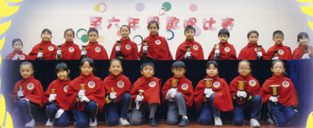
手鈴 / 手鐘隊