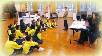
評判的題問時間，同學留心聆聽，用心作答