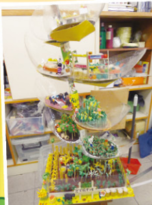
4D 林日山 6A 林日照 獲香港賽二等獎