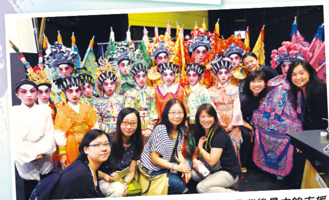
各位導師、家長和老師的專業團隊，是同學背後最大的支援