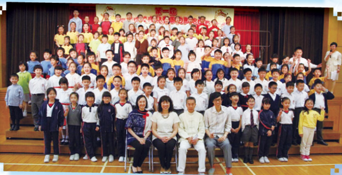
兒童粵曲歌唱比賽，同學表現投入，並贏得不少獎項