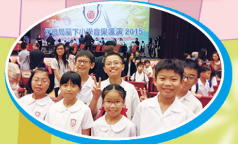
口風琴隊在保良局音樂素質圖表演