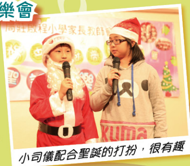
小司儀配合聖誕的打扮，很有趣