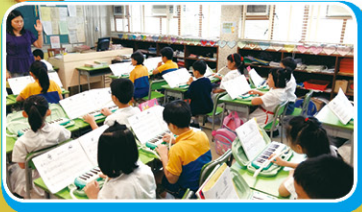
老師細心地講解吹奏的方法

本科在 15-16 以「眼明手快齊閱譜」為題，增強學生閱讀樂譜的能力，使學生在演奏音樂時閱讀樂譜的速度，使學生在演奏時更得心應手。