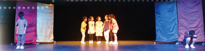
崔校長也來支持同學的公開演出