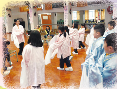
粵劇課中，同學們隨著音樂編編起舞