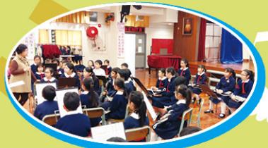
口風琴校隊在比賽前得到校長鼓勵，信心大增