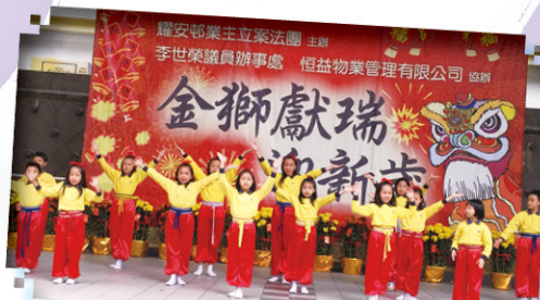
同學參與區內匯演，與居民同慶新春