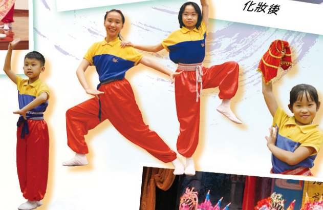
粵劇班同學們均積極練習，為表演作好準備