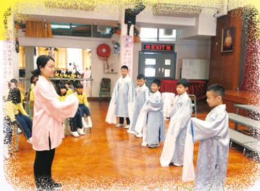
男同學練習舞水袖，也頭頭是道