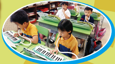
同學認真地上口風琴課