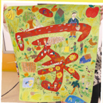
6A 楊辰 獲香港賽三等獎