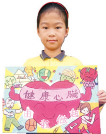
5B 曾錯詩 獲個人賽精英獎