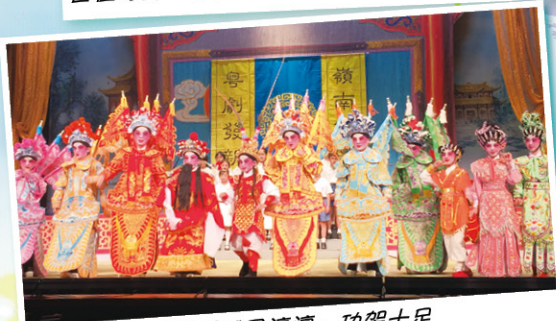
同學們威風凜凜，功架十足