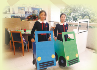
道具組同學的作品