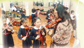
學生一個一個排隊等待調音