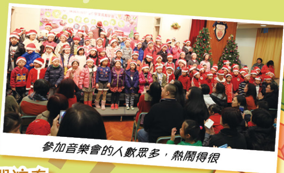
參加音樂會的人數眾多，熱鬧得很