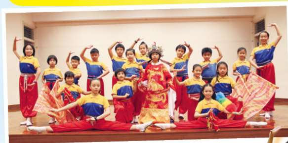
各位同學，努力加油呀！