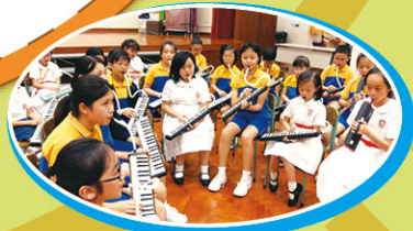
校隊的同学每次練習都很專心