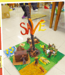
6B 陳詠護 6B 吳雨芯 獲香港賽三等獎及 世界賽三等獎