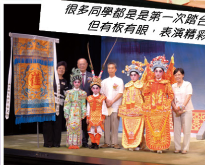
同學表現出色，獲得朱校監和嘉賓們不少讚賞