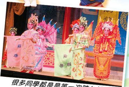
很多同學都是第一次踏台板，但有板有眼，表演精彩