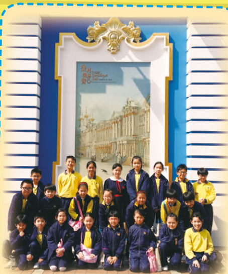
盈藝舍參觀藝術館 - 俄羅斯皇村瑰寶

多年來本校參與了不少大型藝術活動、展覽及比賽，今年更為了配合主題「跨越國界」跳出香港，踏訪新加坡學校作深度藝術交流，讓學生擴闊視野，獲益良多，更體驗不同文化的藝術色彩。來年展望：讓學生跳得更遠更廣，探訪不同西方國家，作深入的藝術交流。