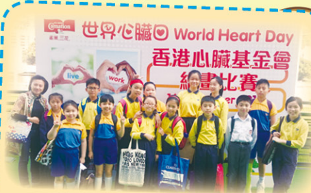
世界心臟日繪畫比賽 2014 大合照