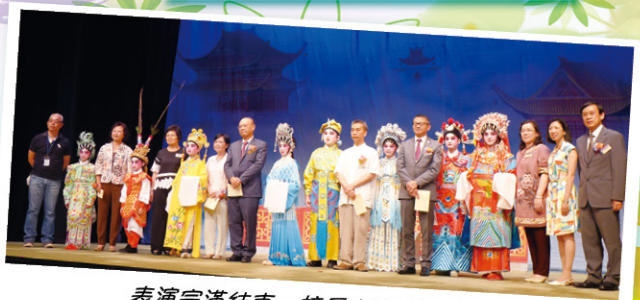
表演完滿結束，校長嘉賓齊來合照