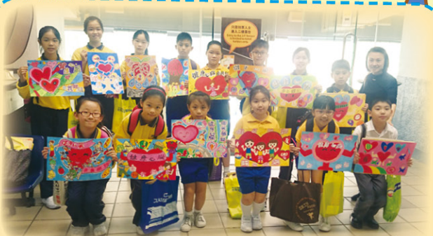
世界心臟日繪畫比賽 2014 獲得團體銅獎