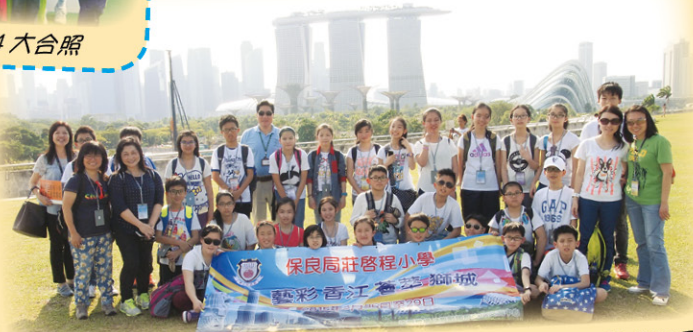
新加坡藝術交流 - 藝彩香江薈萃獅城 - 配合視藝主題「跨越國界」帶領一行 29 人 5 日 4 夜的精彩藝術之旅