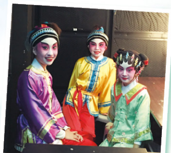
準備出場了，心情緊張又興奮