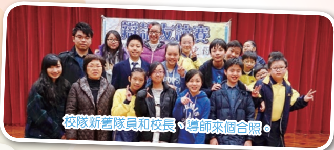
校隊新舊隊員和校長、導師來個合照。

很多人會說辯論只是一項沒趣的活動，不參加也罷。我的意見是相反的，從搜集資料、準備賽事、正式比賽到賽後檢討，當中發生了數之不盡的趣事，使我們可以從中得益，學會接受他人意見，不要盲目追隨自己的想法。